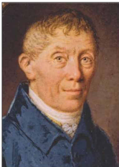
Udsnit af miniature på elfenben

elfenben (7,5 x 5,8 cm), som menes udført af F. C. Camradt ca. 1794 og ejes af Frederiksborgmuseet (A 2726). Portrættet på Københavns Museum er en senere kopi af Frederiksborgmuseets miniature.