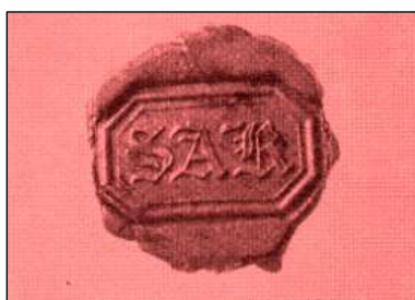
Lakaftryk af signetten Søren Kierkegaard Arkivet A pk. 6

Lakaftrykket på indersiden af forpermen i journalen NB2 (Kierkegaards dagbogsprotokol fra maj til november 1847) forseglers en snor, der skulle fastholde journalens blade, og det blev i 1963 forsynet med en beskyttende grøn ramme.