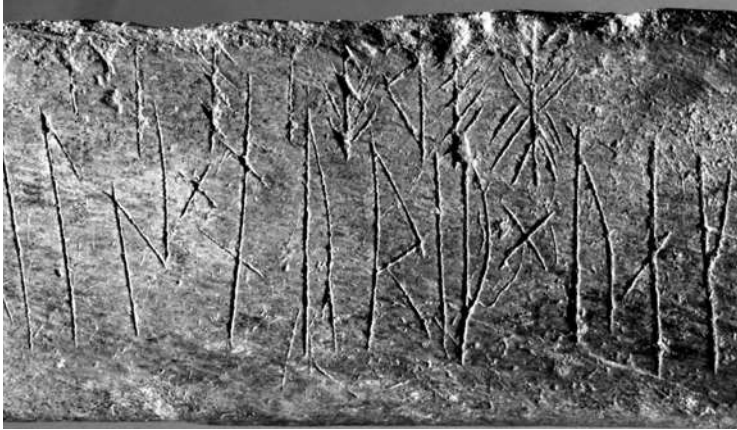
Fig. 2a–b. Detalj av inskriften på feberbenets framsida med de åtta tecknen (överst).

Foto Bengt A. Lundberg, RAÄ (1997). Renritning av författaren.