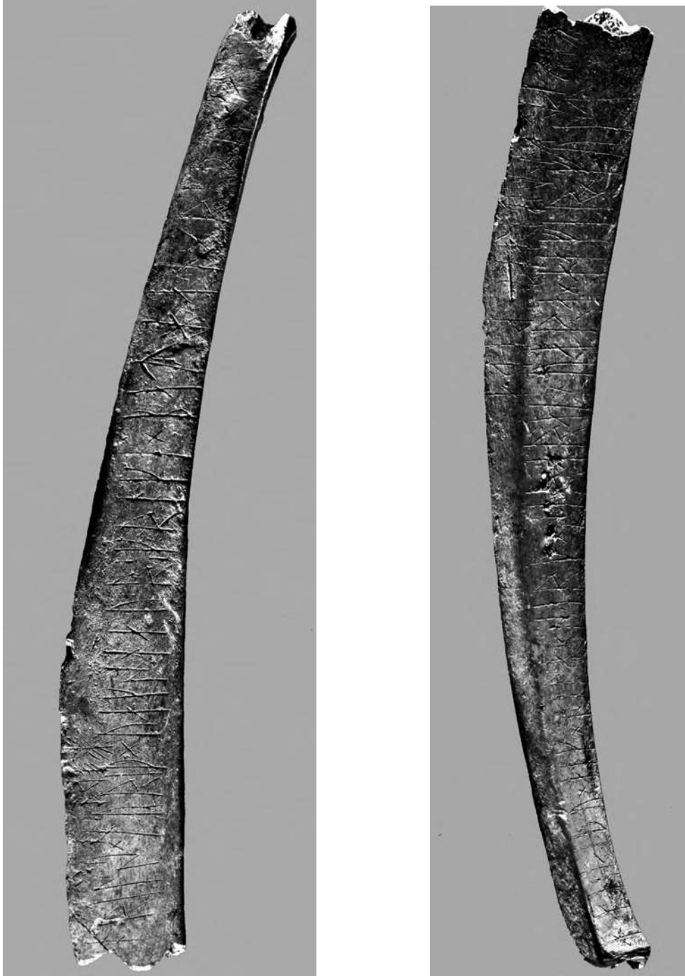
Fig. 1a–b. Foton av revbenets framsida och baksida. Foto Bengt A. Lundberg, RAÄ (1997)