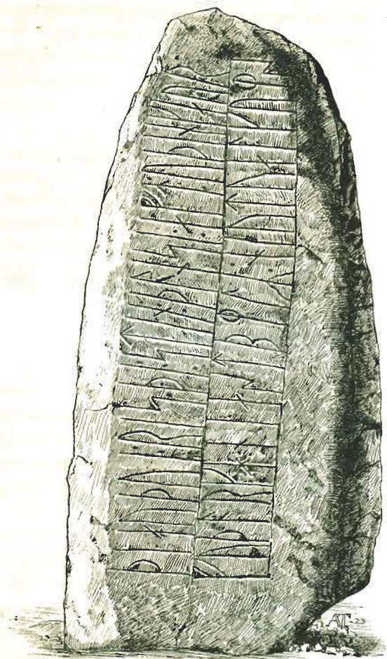
Runestenens A-side (Se fodnoten s. 52).