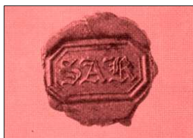
Lakaftryk af signetten Søren Kierkegaard Arkivet A pk. 6

Lakaftrykket på indersiden af forpermen i journalen NB2 (Kierkegaards dagbogsprotokol fra maj til november 1847) forsejler en snor, der skulle fastholde journalens blade, og det blev i 1963 forsynet med en beskyttende grøn ramme.